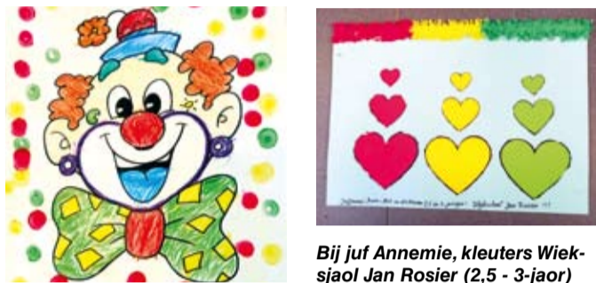
Bij juf Daniëlle, kleuters centrum Jan Rosier (2,5 - 3 jaor) hóbbe ze de krachte gebundeld um e sjoen vastelaovendsmasker vur uch vaerdeg te maake. Klassewerrek, wej dastte het ouch bekieks. Werrek van enen hiele groep en e sijk eindproduc.