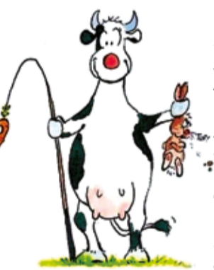
De kins noets waete hoe 'n koo 'nen haas vingt.