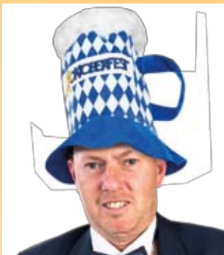
Erwin ès al good ien form ...