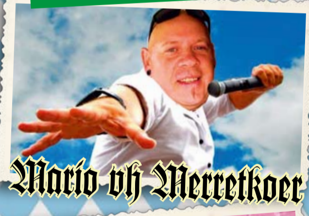
Mario of Herretkoer