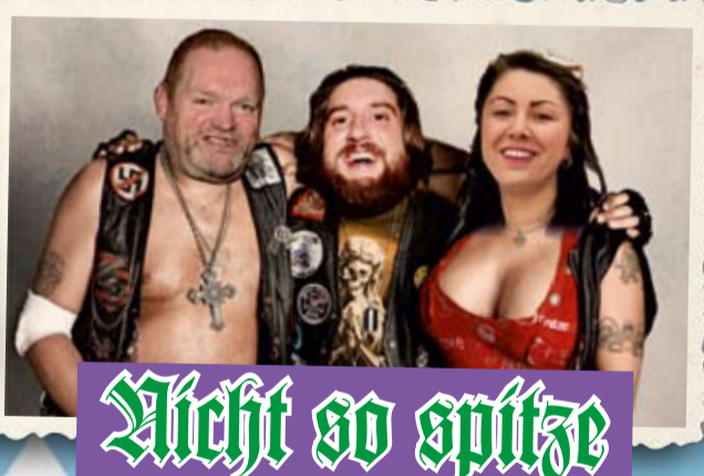
Nicht so spitze