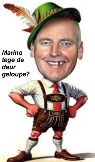
Marino tege de deur geloupe?

Bekans aeve populair as karneval, iech zèk hiel oetdrökkelek "bekans", zien de oktoberfieste mèt manne deij liters beer verzette um hunne maag te speule. Mèt vrouluig deij gaere hun weelderege of besjeije balkóns ien de etalaasj zette, zoe zien de oktoberfieste aan hunnen opmars begós as cultuurfenomeen. Nit umwille van de zoepende manne en de proonkende medamme. 'Laoneke ès de poort van Europa', zag oets ein van m'n illustere börgemeistervurgangers. Aal of nit neuchter? Dat laot iech ien het midde! Feit ès wel dat alle culturele en aander maotsjappeleke fenomene oet de waereld zich heij manifestere: Hells en aander Angels op