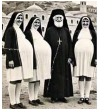
Een Babylonische spraakverwarring? Iech zék: "Gebruuk ne condoom!" Haer versteit: "Gebruuk carbon(pepier)"

Ene aannummer ès mèt ene collega gezellig aan 't keuvele euver de vekaansie, deij jus um ès. "Awel", zaet den eine, "iech bin nouw drei kier ien Italië op vekaansie gewaes en ederes kier ès m'n vrouw ien verwachting." Zaet den aandere: "Gaank dan ins nao een aander laand, Kroatie ès sjoen en Spanje ouch!" "Iech weit het nit, meh iech deenk dat iech ze volgende kiere gewoen op vekaansie mètpak!"